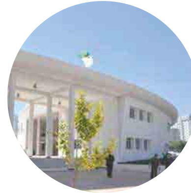
o Lycée international de Kouba