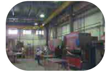
Pliage Conventionnel et CNC et panneautage