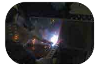
Soudure par point