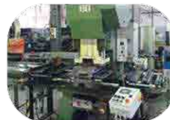
Découpe sur Presse