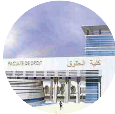
o Faculté de droit