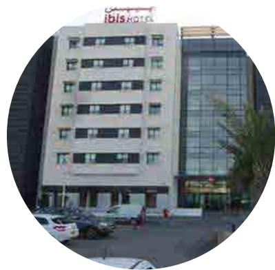
o Les Falaises d'Oran