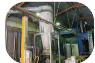
Peinture à Poudre EPOXY