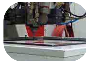
Pose Joint ou Colle