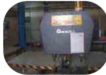
Découpe laser CNC